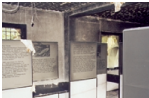
Brandanschlag Gedenkstätte Todesmarsch im Belower Wald, 2002