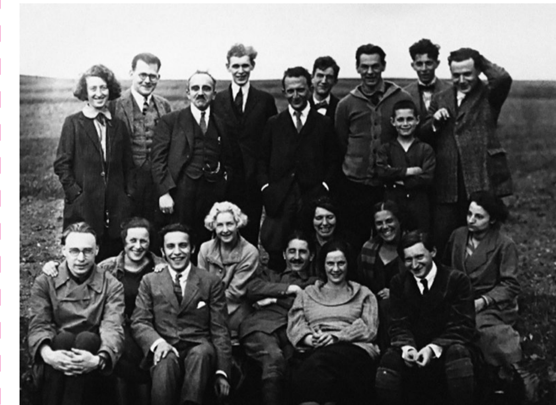
Gruppenphotographie Marxistische Arbeitswoche Geraberg 1923

Alle unsere Veranstaltungen finden im Haus auf der Mauer, Johannisplatz 26 in 07743 Jena, statt.